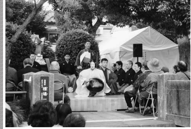
妙亀塚では奉納能も行われるなど、鬼平ゆかりの地ならではの江戸情緒あふれる企画が続々

『鬼平犯科帳』の舞台となった墨田区および台東区浅草エリアには、同小説の舞台となった店が数多く点在する。そんな地域資源を積極的に活用し、物語とPRしつづけている。