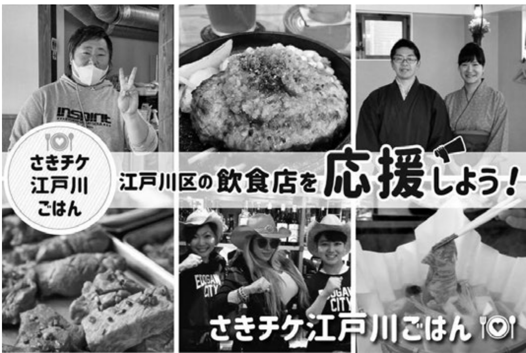
インターネットに掲載した江戸川区商連のプロジェクトの1ページ

店が悲鳴を上げていた時に、急を要する判断した江戸川区が、ガッパ協力した。区は、区商連がクラウドファンディング運営会社に支払う手数料や、事務経費を助成。さらには、一刻も早く資金を届けるためのプロジェクト進行中の5月15日にいったん集計し、500万円を区が区商連に貸して各飲食店に入金。6月上旬には早々に2回目の入金もした。