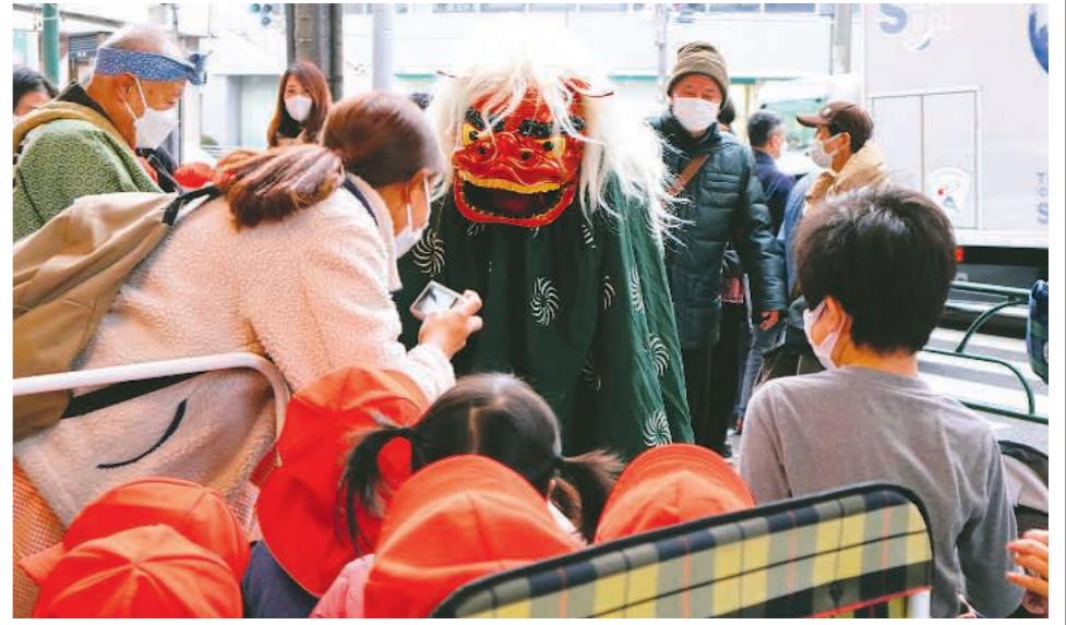
珍しい獅子舞と園児の記念撮影をお願いする保育士