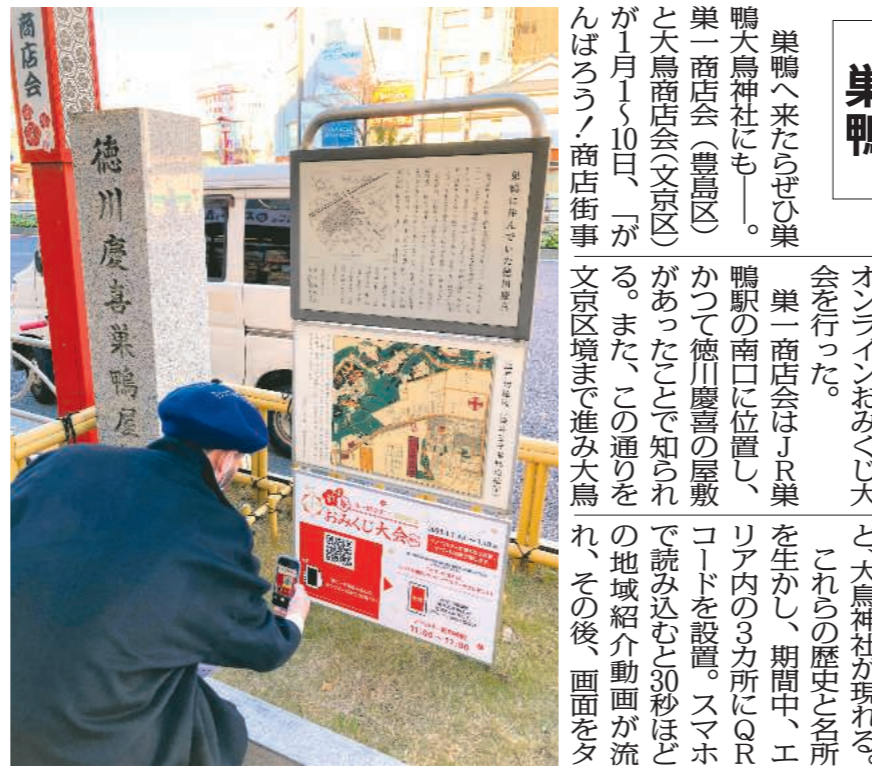
巣鴨商店街では慶喜の屋敷跡にQRコードを設置

業のイベントで新春商店街の通りに入るオンラインおみくじ大会を行った。 巣鴨へ来たらずい巣鴨大鳥神社にも。巣鴨一商店街はJR巣鴨駅の南口に位置し、かつて徳川慶喜の屋敷があったこと知られが1月10日、「がらぼろ」商店街事業文京区境まで進み大鳥神社へ、この通りをの地域紹介動画が流れ、その後、画面をタップするとおみくじを引けるようになった。 みごと大吉が出たら、スマホ画面で大鳥神社の宮司に見せに行くと、巣鴨一商店街と大鳥神社は4月から合併、「どうしてもほづへ人が流れやすいので、商店街を巣鴨駅から大鳥神社までの表参道とらえ、人の流れをつくりたかった。今後は街路灯のデザインを統一したり、カモが羽ばたくとストーリーのイベントを展開したりして盛り上げた」といふ。