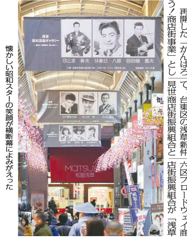
懐かしい昭和スターの笑顔が横断幕にみまがらう

再開した「がらぼろ」で、台東区の浅草新仲六区アロードウェイ商店街振興組合と、見世商店街振興組合と、店街振興組合が「浅草昭和芸能ギャラリー」の企画で、映画あり、写真あり、笑ありの「昭和スターずらり」を、12月11日から1月22日まで合同で開催した。 両商店街周辺が、かつて映画演劇の殿堂としてにぎわったことから企画した。 六区アロードウェイでは、映画「男はつらいよ」シリーズのポスターをパネル化し、アート展として昭和スターを醸し出し、盛り上げた。 新仲見世では、昭和スターたちの懐かしい写真が印刷された、横幅が3段にもなる横断幕を28枚、東西380段に及ぶアーケードに掛けた。 三波春夫・春日八郎・田畑義夫さんら1950年代の戦後大スターから松本伊代さんら80年代アイドルまでがほほ笑む写真は、すべてモノクロ。新仲見世にある老舗で撮影スタジオを持ち、オリジナル写真を「プロマイド」として販売するマルベリ堂が提供した。 イベントでは記念キャンペーンとして、商店街で買い物をするたびに、横断幕に写真のあるスターたちのヒット曲をBGMとしても流しており、商店街を散歩する客が口ずさみながら歩く姿も見られた。