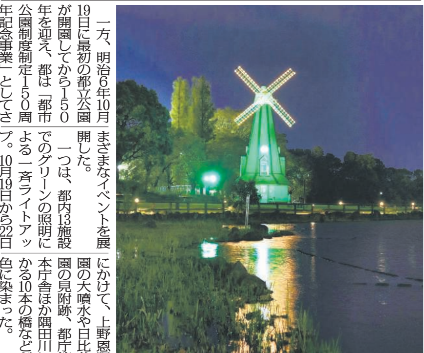
浮間公園(板橋・北区)では風車が緑色に

東京都は、100年 先を見据えた新たな緑のプロジェクト「東京グリーンヒズ」を8月に開始し、このほど都の取組をまとめたPR冊子を公表した。 東京都は、100年 先を見据えた新たな緑のプロジェクト「東京グリーンヒズ」を8月に開始し、このほど都の取組をまとめたPR冊子を公表した。 東京都は、100年 先を見据えた新たな緑のプロジェクト「東京グリーンヒズ」を8月に開始し、このほど都の取組をまとめたPR冊子を公表した。