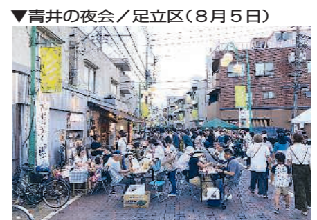
▶青井の夜会/足立区(8月5日)