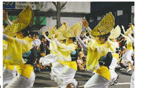
▶東京高円寺阿波おどり/杉並区 (8月26・27日)