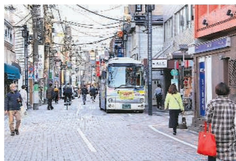
▶浜田山手はレンガ舗装に変わる

3月31日 観光立国推進基本計画が閣議決定 「訪日外国人の旅行消費5兆円」など早期達成を目指す