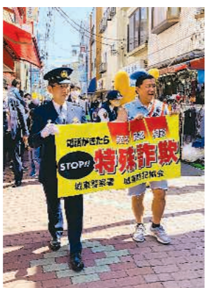
▶江東区の砂町銀座商店街