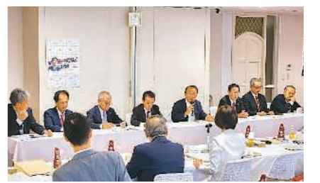
▶役員らが自民党本部を訪ね要望

10月5日 都商連・都振連、 国に商店街振興組合法の見直し要望 組合設立要件の緩和求める