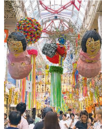
▶阿佐谷七夕まつり/杉並区 (8月4~8日)