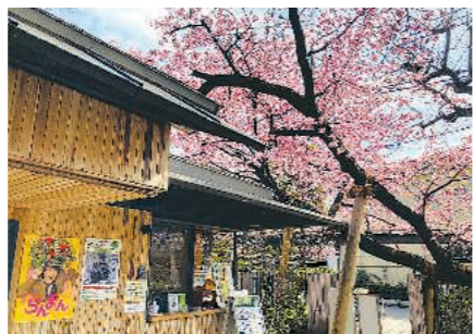
▶大泉学園の牧野記念庭園