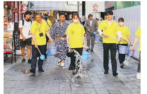
▶新宿東口商店街での打ち水(8月3日)