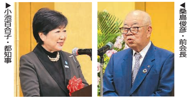
▶小池百合子・都知事