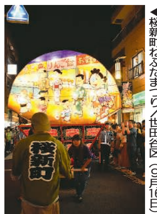
▶接新町なまなままつり/世田谷区(9月16日)