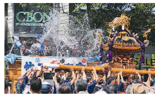
▶富岡八幡宮水かけ祭り/江東区 (8月11~15日)