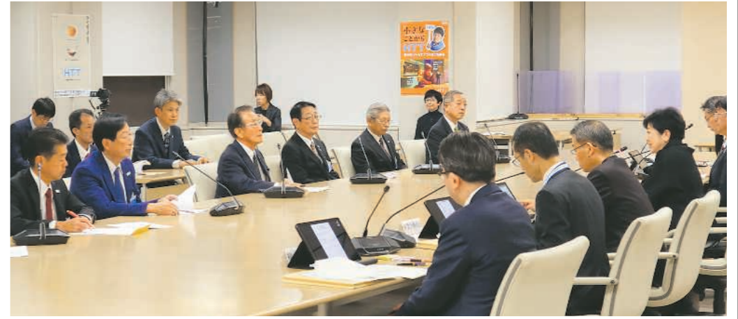
都知事と要望内容について話す山田理事長(前列左から3人目)