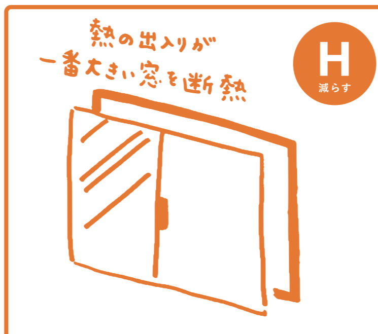
複層ガラスや二重窓で高い断熱性