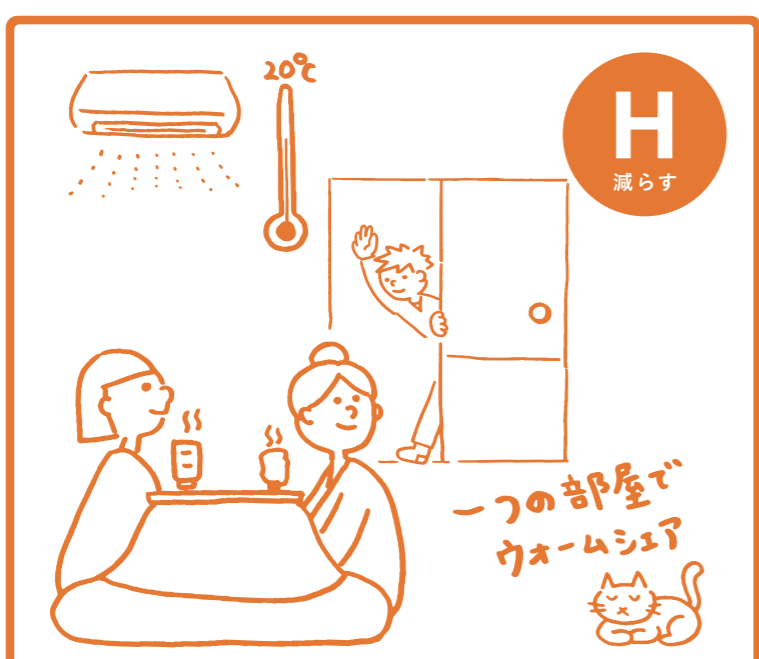
みんなで温かい部屋に集まろう