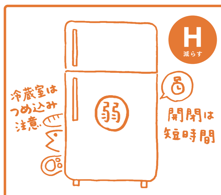
冬の冷蔵庫は『弱』設定