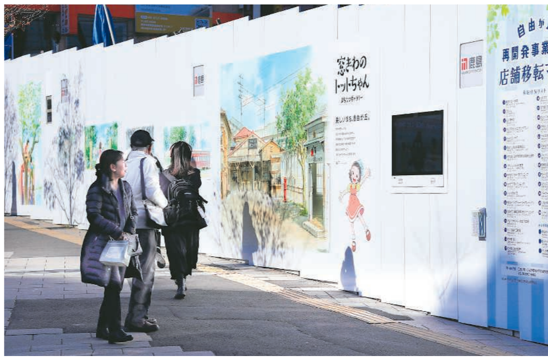
駅正面口を出てすぐの「まちなかギャラリー」。足を止めて眺める人も

東急東横線「自由が丘駅」が昨年12月4日、区と配給会社「自由が丘駅前(目黒)」から1月18日まで行われる「自由が丘駅前」の3者が協力し合い、実地での再開発工事現場「自由が丘駅前」で、壁画の壁画にアニメ映画「トットちゃん」の壁画を制作する。壁画の壁画は、アニメ映画「トットちゃん」の壁画を制作する。壁画の壁画は、アニメ映画「トットちゃん」の壁画を制作する。壁画の壁画は、アニメ映画「トットちゃん」の壁画を制作する。