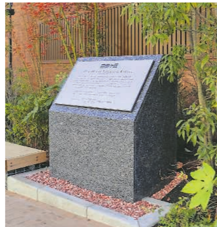
トモ工学園の跡地にある記念碑

が主体となり設置することになった。仮囲いに展示された、木造駅舎や学校の風景などのアートは、配給会社による制作。映画の宣伝になる文意は使えないという制約の中、自由が丘の魅力は変わらぬと、この機会を捉え、協力してくれた。