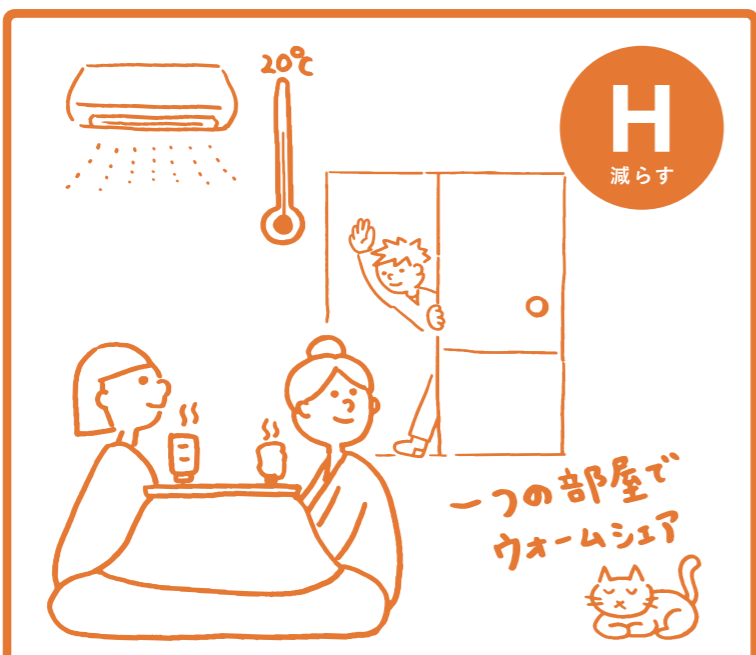
みんなで温かい部屋に集まろう