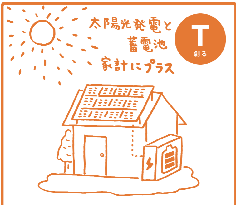
自分で作るおうちの電気