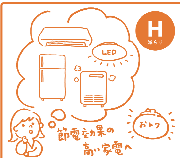
お得に買替 かしこく節電