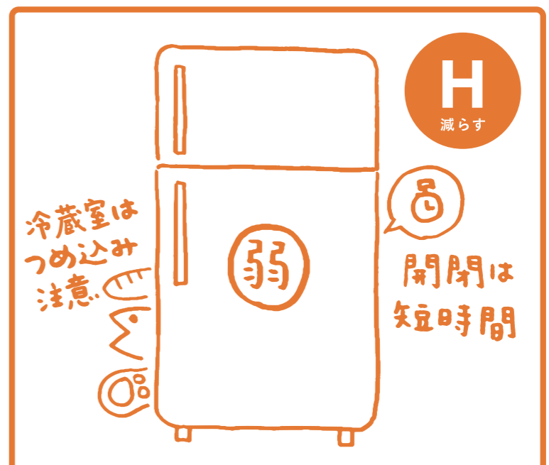
冬の冷蔵庫は『弱』設定