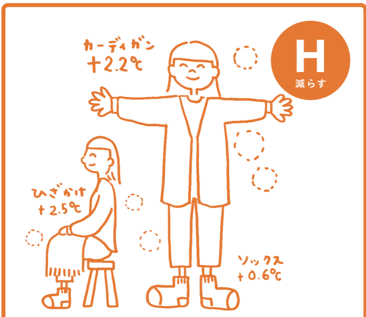
一枚重ね着して冬を快適に