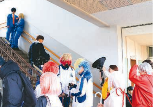
廃校となった小学校も商店街エリアにあり、校舎の階段は撮影が順番待ちになるほどの人気スポット